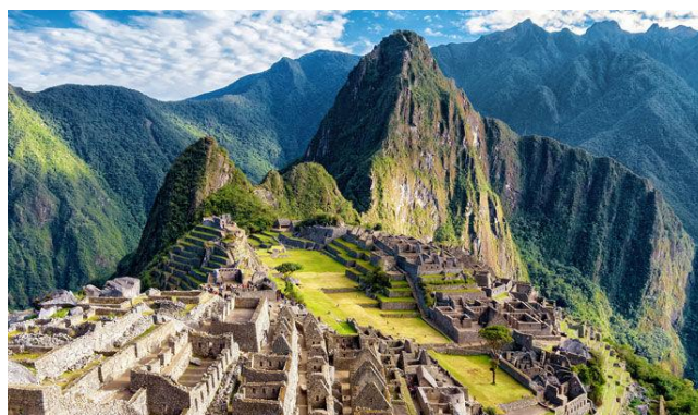
Le Macu Pichu