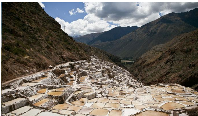
Récolte de sel dans de petits bassins